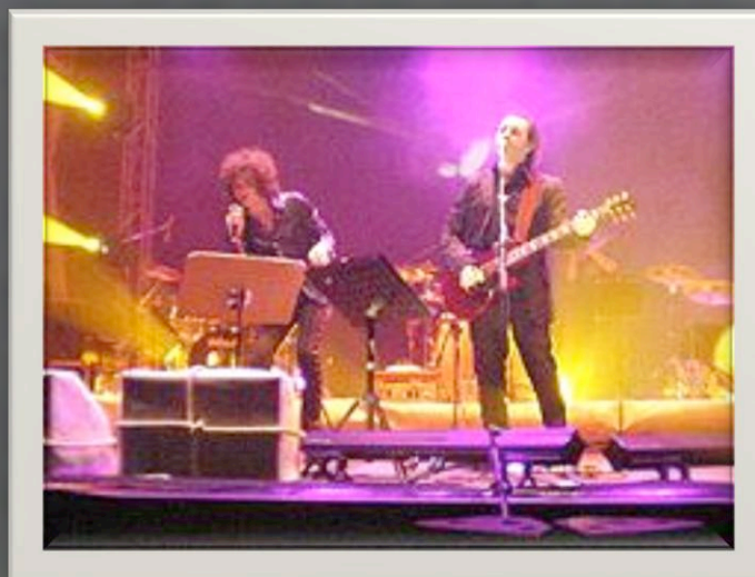
Distrito14: “Historia de un grupo de rock” por Juanma Bajo Ulloa